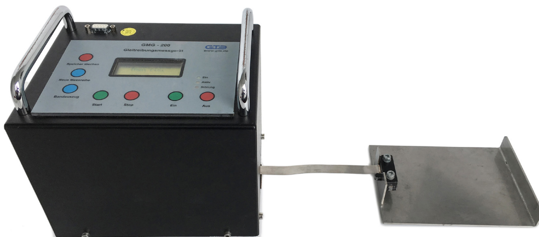
Figuur 3 - Een tribometer

Een dergelijke vergelijking kan dus leiden tot onder- dan wel overspecificatie. De verschillende methodes kunnen daarom alleen opzichzelfstaand of aanvullend op elkaar worden ingezet om te specificeren en te monitoren.